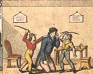
La, luce, in, una, del, di, non, e, bella, Non, se, e, ch'è, pardi, non, dove, ha, il, canale.