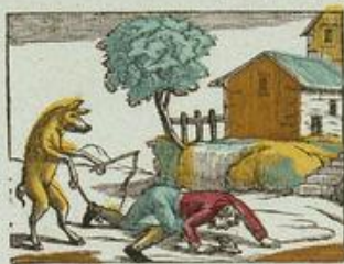
Le cochon conduisant un homme.