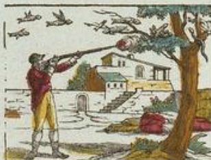
Les poissons volans.