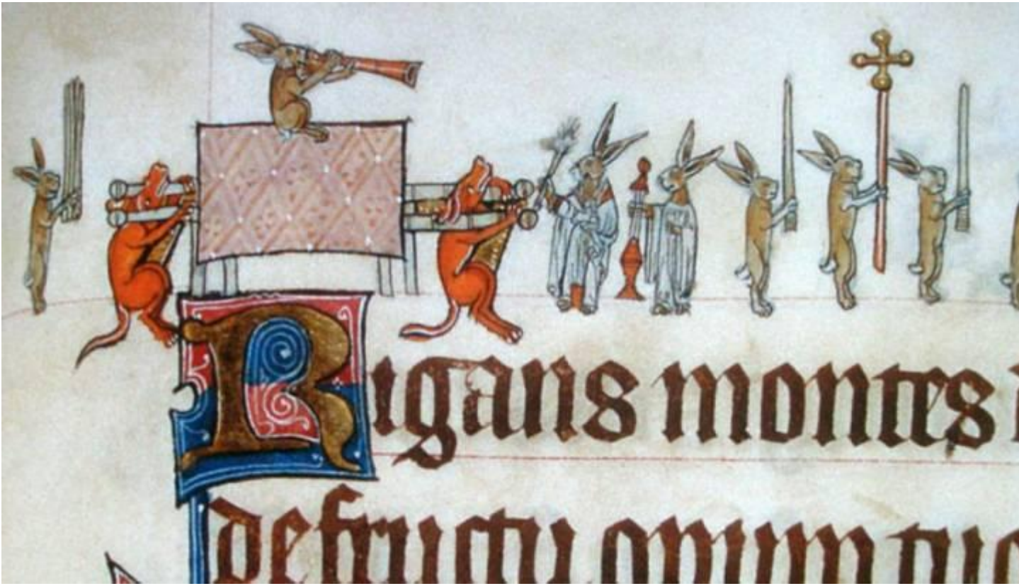
Funerali di Fox Renard. Salterio di Gorleston. Inghilterra, 1310-1324. biblioteca britannica