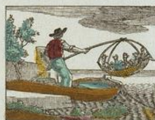
L'homme qui pêche des coqs.

De la fabrique de A. F. HUREZ, Imprimeur-Libraire, Grande Place, à Cambrai.