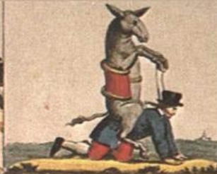
Spesso mirate in ogni, ad altri, gente, L'etere, si alle, e il polentone in face.