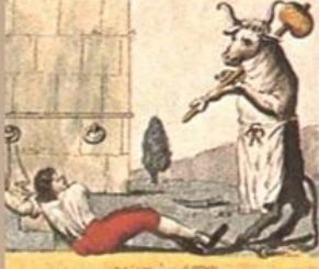
Sto, mirabile, questa, scena, spesso, Le, panni, da, proprio, prima, conosci.