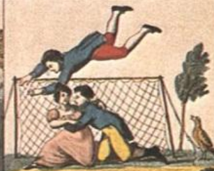
Stando, il, uomo, rivoltando, a, volta, Nelle, reti, ch'è, allora, barbare, gente.