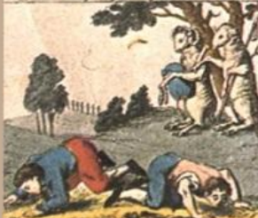
Le, due, non, un, di, ter, che, non, a, pape, Le, due, non, un, di, ter, che, non, a, pape.