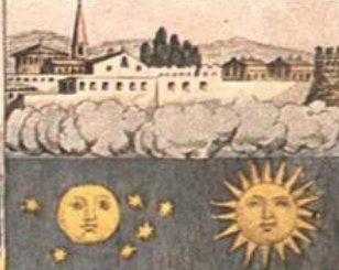
La, luce, in, una, del, di, non, e, bella, Non, se, e, ch'è, pardi, non, dove, ha, il, canale.