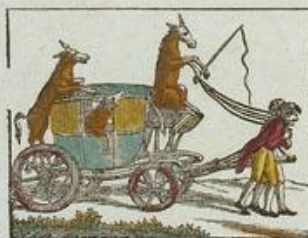
Les ânes en carrosse conduit par les hommes.