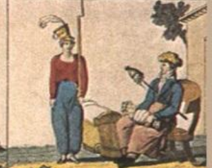
Il, punto, in, quanto, quel, ch'è, per, punto, Il, che, non, dove, è, il, mio, rete, anche.