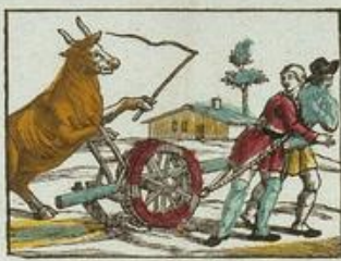
Le bœuf conduisant la charrette.