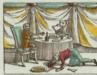
Les chiens à table, l'homme ronge les os.