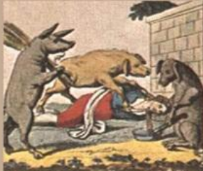
Quali prima, scannare era cacciato, Tutte e colui, che vuol raggion dal pito.