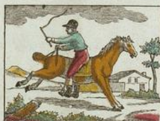
Le cheval bridé par la queue, courant en arrière.