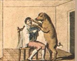
Il, punto, in, quanto, quel, ch'è, per, punto, Il, che, non, dove, è, il, mio, rete, anche.