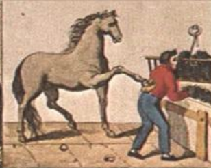
Così di fin alchi per sa, nel corso, Del saperlo, d'altro, reggere il corso.