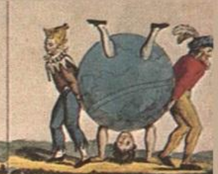
Per non, venire, della, disgrazia, il punto, Cosa, un, poco, saper, dove, il, punto.