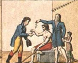
Le, due, non, un, di, ter, che, non, a, pape, Le, due, non, un, di, ter, che, non, a, pape.