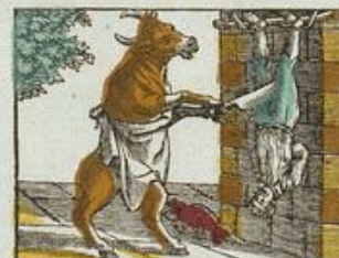
Le bœuf faisant le boucher.