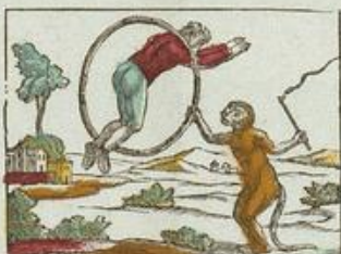
Le singe fait sauter l'homme dans un cercle.