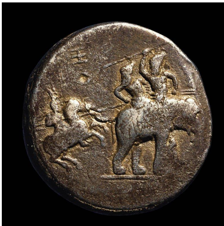
Moneta d'argento del 323 a.C., in cui Alessandro a cavallo si scaglia contro un elefante in battaglia contro re Poro. British Museum, Londra

Da questa regione, Dario re dei Persiani (550-486 a. C.) copiò il loro uso militare. I persiani nel 331 a.C. sconfissero il re macedone Alessandro Magno che non riuscì a gestire la sua cavalleria contro questi grandi animali. Alessandro introdusse lui stesso gli elefanti nel suo esercito e riuscì a sconfiggere il re persiano Poro nel 331 a. C. ma rinunciò alla avanzata nella sua conquista dell'Oriente, quando venne a sapere che dopo i persiani avrebbe trovato un esercito di dai 300 ai 600 elefanti dei regni asiatici di Magadha e Gangaridai. Tornato in patria a Babilonia creò una guardia di pachidermi a guardia del suo palazzo.