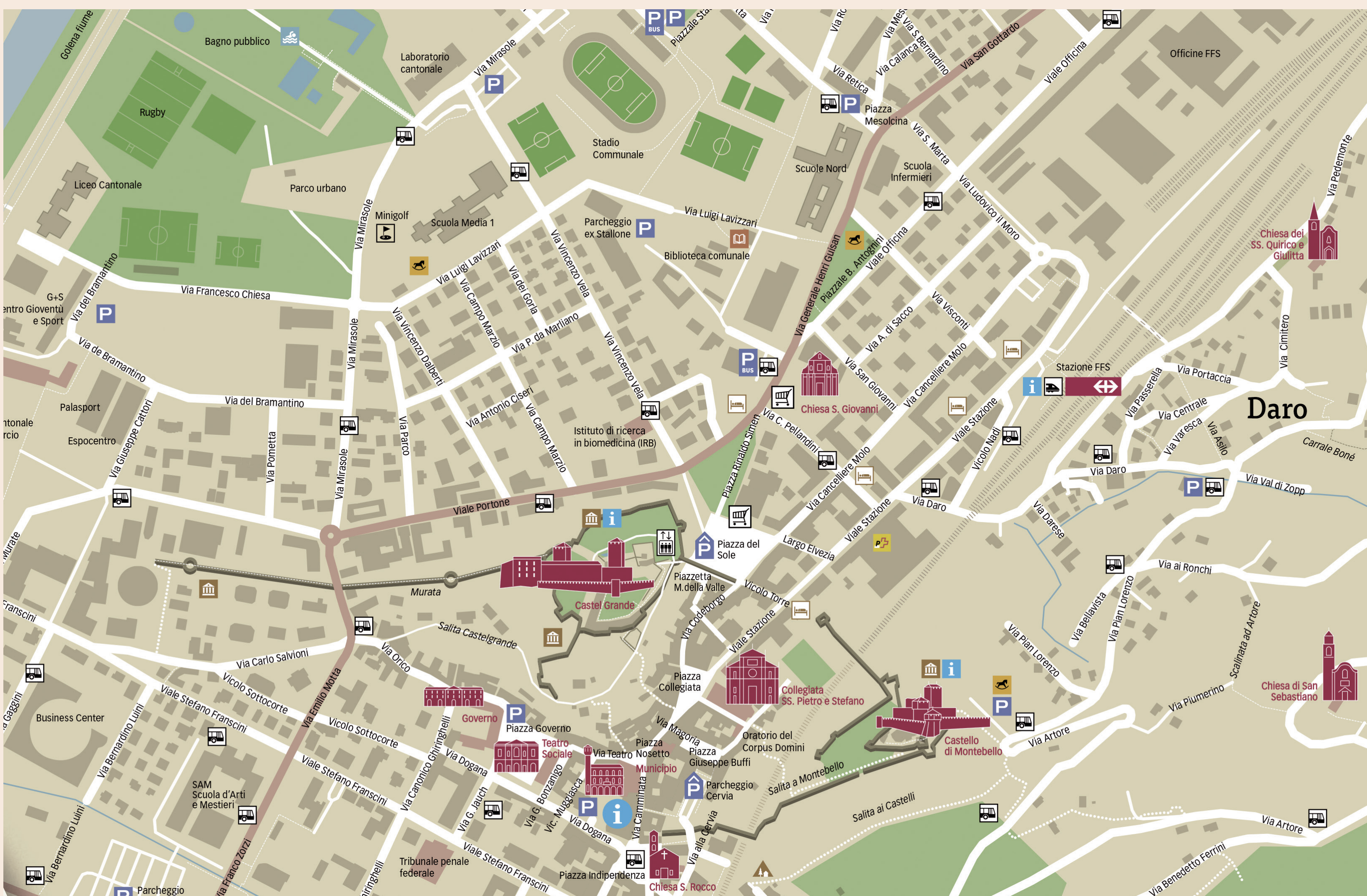
Bellinzona oggi, Città di Bellinzona

1874 Inaugurazione stazione di Bellinzona e prime tratte ferroviarie del Cantone