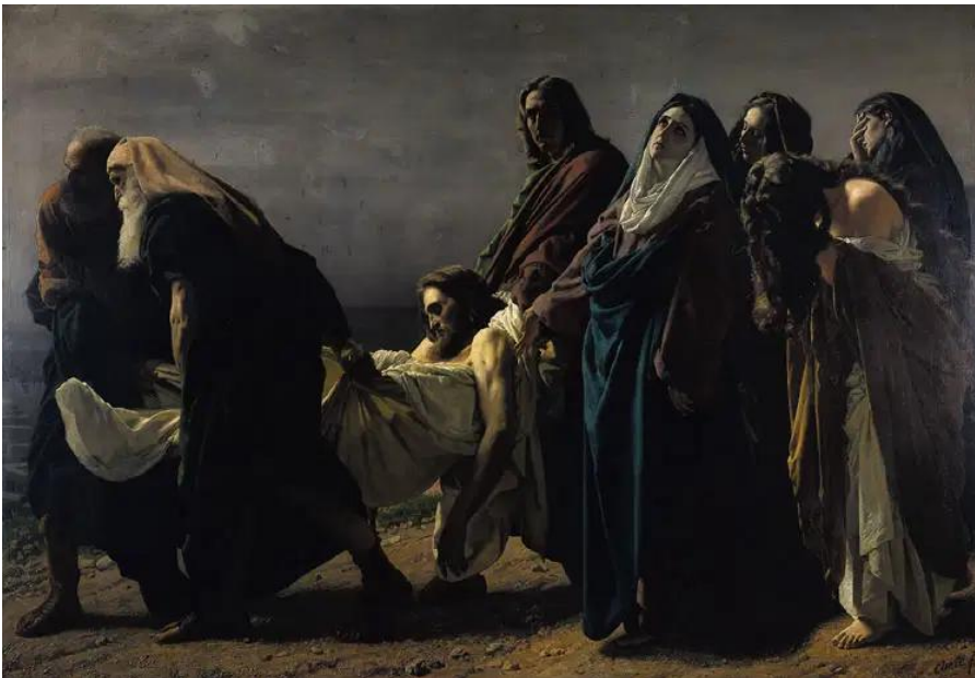
Antonio Ciseri, Trasporto di Cristo al sepolcro, 1864-1870, Santuario della Madonna del Sasso, Orselina

Cristo" (1864-70). Se l'intensità del dolore espresso è del tutto simile, l'altorilievo di Vela impressiona per il realismo delle figure: i cappellacci, i pantaloni, gli scarponi traducono veristicamente le condizioni degli umili lavoratori. Viene descritto il loro lavoro per farne non solo un manifesto umanitario ma anche la denuncia politica di una questione sociale. Nell'opera risalta la precisione anatomica delle figure a torso nudo, delle braccia e della postura: capo chino, spalle curve, per un verso abitudini derivate dalle condizioni del lavoro di scavo ma ora anche per la tristezza di quel trasporto. Risaltano in particolare il braccio inerte della vittima e tutte le mani, quest'ultime realizzate da un calco dal vero per una resa più realistica. Anche gli oggetti, il pesante martello e le lampade, animano la scena. La lampada dell'operaio in procinto di uscire dal tunnel è accesa e una lieve corrente d'aria muove la fiamma, mentre la lampada senza fiamma dell'uomo avvolto nel mantello fa pensare alla vita che si è spenta. È pure evidenziato nell'opera il manico ad uncino utilizzato per appendere le lampade, da cui i lavoratori dipendevano per il loro lavoro e per affrontare le insidie della galleria. Ancora oggi quest'opera d'arte esprime valori universali perché ci ricollega a tante tragedie e sacrifici le cui immagini sono, non di rado, diffuse dai nostri media.