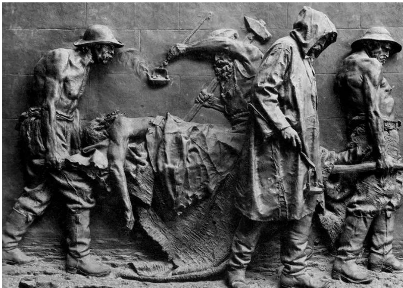
Le vittime del lavoro (1882) Bronzo, fusione postuma (1895) Galleria nazionale d'arte, Roma

L'opera esposta nel 1883, in un modello in gesso, all'Esposizione nazionale Svizzera di Zurigo, rappresentò per Vela il culmine del suo successo in patria, ma la speranza di vederla subito realizzata in bronzo e collocata all'imboccatura sud del Traforo del San Gottardo rimase inappagata. Solo nel 1932 una fusione fu collocata all'imbocco del traforo del Gottardo di fronte alla stazione ferroviaria di Airolo in occasione del cinquantesimo della ferrovia. Altre due fusioni postume si trovano a Roma presso la Galleria nazionale d'arte moderna e contemporanea e presso l'Istituto Nazionale per l'Assicurazione contro gli Infortuni sul Lavoro: queste collocazioni sanciscono il successo dell'opera anche all'estero.