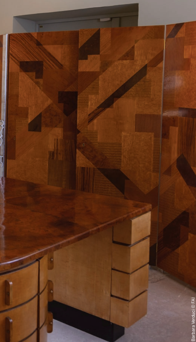
Barbara Verduci © FAI