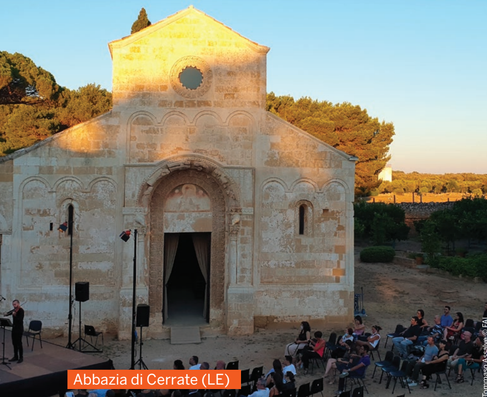
Abbazia di Cerrate (LE)