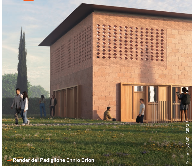
— Render del Padiglione Ennio Brion