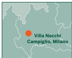
— Villa Necchi Campiglio a Milano è stata donata al FAI da Gigina Necchi Campiglio e Nedda Necchi, nel 2001